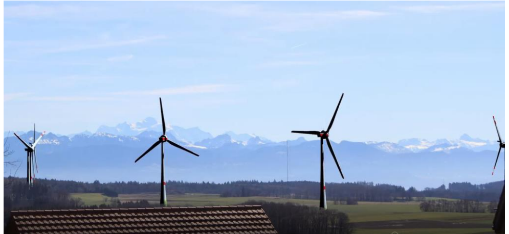
Le parc depuis Berolle, image du film 2D/3D

L'Association PieduVent a été créée le 30 octobre 2014 après l'annonce du projet de création d'un Parc Industriel de 7 éoliennes dans la plaine de Bière par la SEFA (Société des Forces motrices de l'Aubonne). Les premières réactions se firent rapidement entendre dans le village voisin de Berolle. Village qui, si le parc industriel voit le jour, aura en permanence dans son champ de vision ces sept affreuses machines.