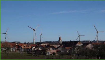
Le parc depuis Bière, image du film 2D/3D

En 2014 , une interpellation au niveau communal a été déposée dans le village de Berolle. Le résultat a été sans appel : 78% de non au projet de parc industriel. Certes, la commune de Berolle n'a juridiquement que peu de poids étant donné que les sept éoliennes seraient implantées sur territoire de la commune de Bière. Néanmoins, cela a donné un signal fort au promoteur que l'on serait là pour lui mettre des bâtons dans les roues.