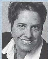
Isabelle Chevalley Conseillère nationale vert'libérale / VD