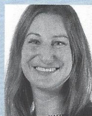
Adèle Thorens Conseillère nationale Les Verts / VD