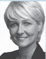
Isabelle Moret Conseillère nationale PLR / VD